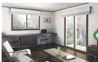
内窓設置:かんたんマドリモ 内窓 プラマードU