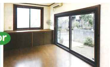
外窓交換:かんたんマドリモ 断熱窓